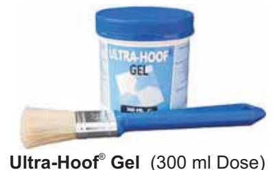
Ultra-Hoof® Gel (300 ml Dose)