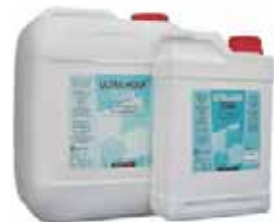
Ultra-Hoof® Clear 10 Liter Ultra-Hoof® Clear 2 Liter