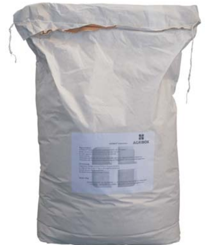
AGRIBOX® Stalleinstreu 25 kg Sack

Inhaltsstoffe: Kalkstein in Puderform, Eukalyptusöl